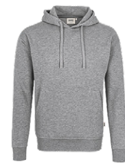
015 grau meliert