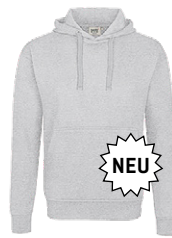
024 ash meliert