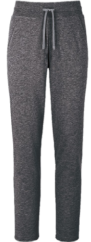
328 anthrazit meliert