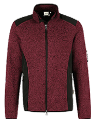
317 weinrot meliert