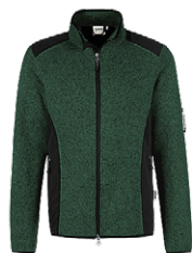
372 tanne meliert