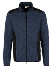
329 marine meliert