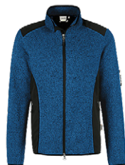
310 royalblau meliert