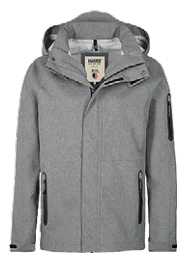
315 dunkelgrau meliert