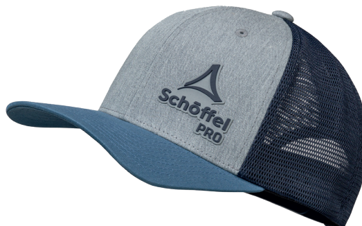
Cap Blueshield Farb-Nr. 8436 BLAU