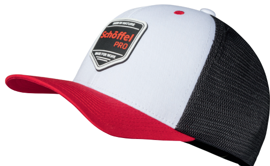
Cap Redshield Farb-Nr. 2001 ROT

Die SCHÖFFEL PRO CAP besticht durch ihre hochwertigen Materialien und die klassische Passform. Sie bietet Schutz vor der Sonne und störender Schweiß wird mit dem integrierten Schweißband abgeleitet. Unübertroffener Tragekomfort wird durch das flexible Schweißband in Kombination mit dem weitenregulierbaren Verschluss gewährleistet.