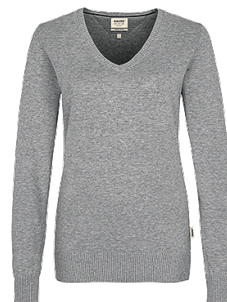
015 grau meliert