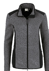
328 anthrazit meliert