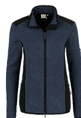
329 marine meliert