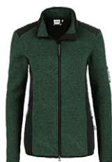
372 tanne meliert