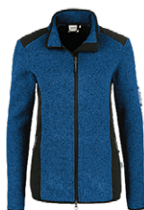
310 royalblau meliert