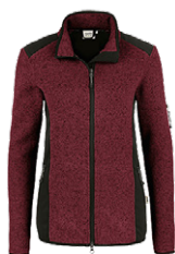
317 weinrot meliert

Ursprungsland Kambodscha Zolltarifnummer 6110 3091 Datenblatt Stand: 02/2023