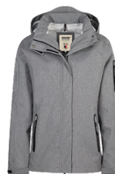
315 dunkelgrau meliert