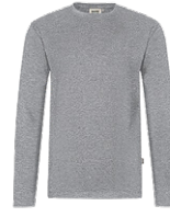
015 grau meliert