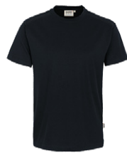
405 hp schwarz