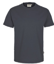
428 hp anthrazit