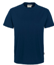
434 hp tinte