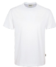
401 hp weiß

Ursprungsland Laos Zolltarifnummer 6109 9020 Datenblatt Stand: 02/2023