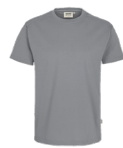
443 hp titan